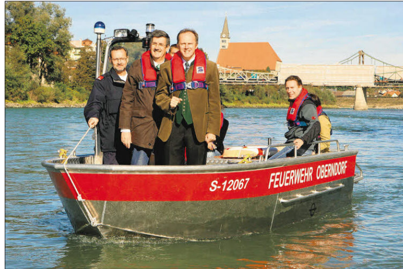
Die Salzach wieder naturnäher zu machen, ist Ziel der Landespolitik.

Aufbauend auf dem generellen Projekt für die Gesamtstrecke zwischen St. Georgen und der Sohlstufe Lehen sollen in die Niederwasserperioden 2006/06 und 2008/09 im Freilassing Becken und in der Laufener Enge die ersten Module umgesetzt werden. Hauptziel sei dabei der